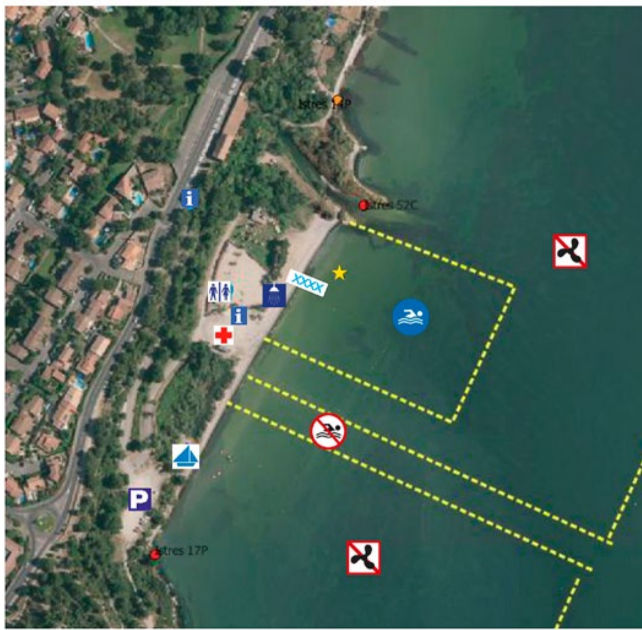
Profil de vulnérabilité des eaux mis à jour en 2024