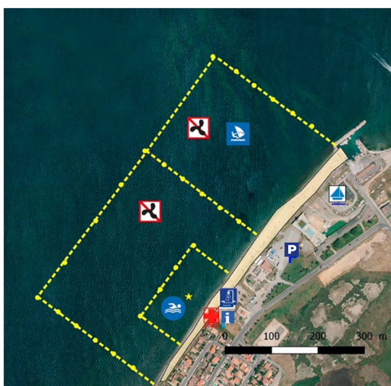
Profil de vulnérabilité des eaux mis à jour en 2024