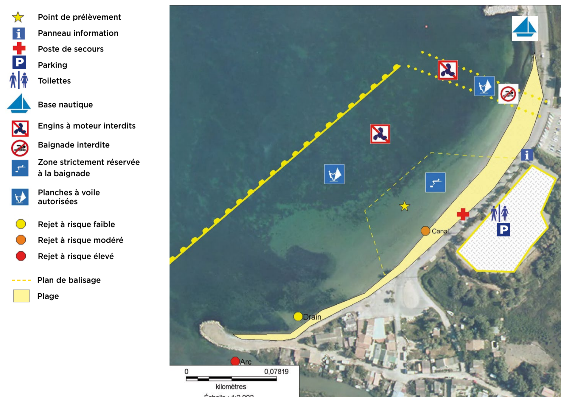
Profil de vulnérabilité des eaux mis à jour en 2024