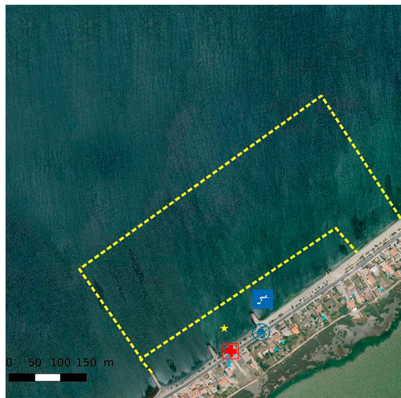
Profil de vulnérabilité des eaux mis à jour en 2024