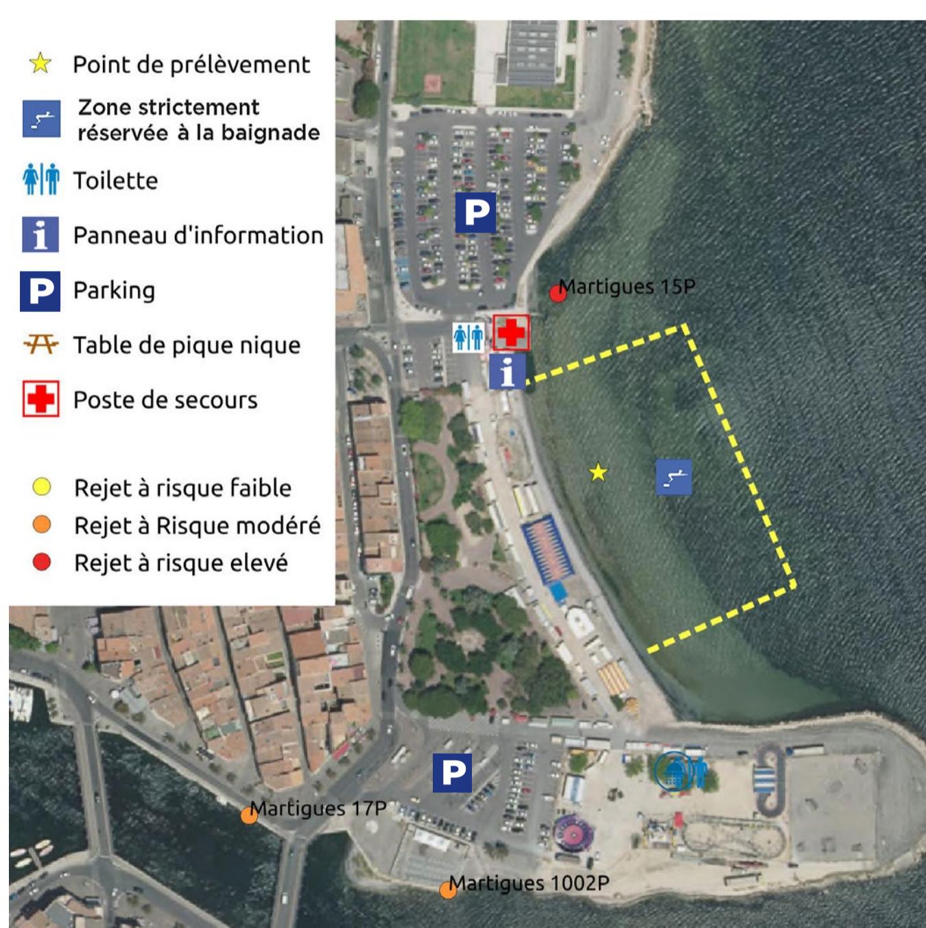
Profil de vulnérabilité des eaux mis à jour en 2024