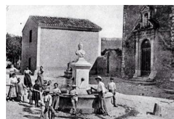
Rognac - La Place de l'Eglise