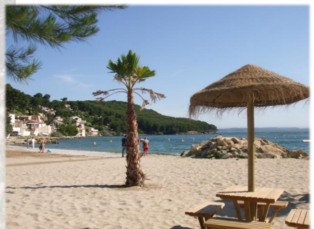
Plage du Ranquet