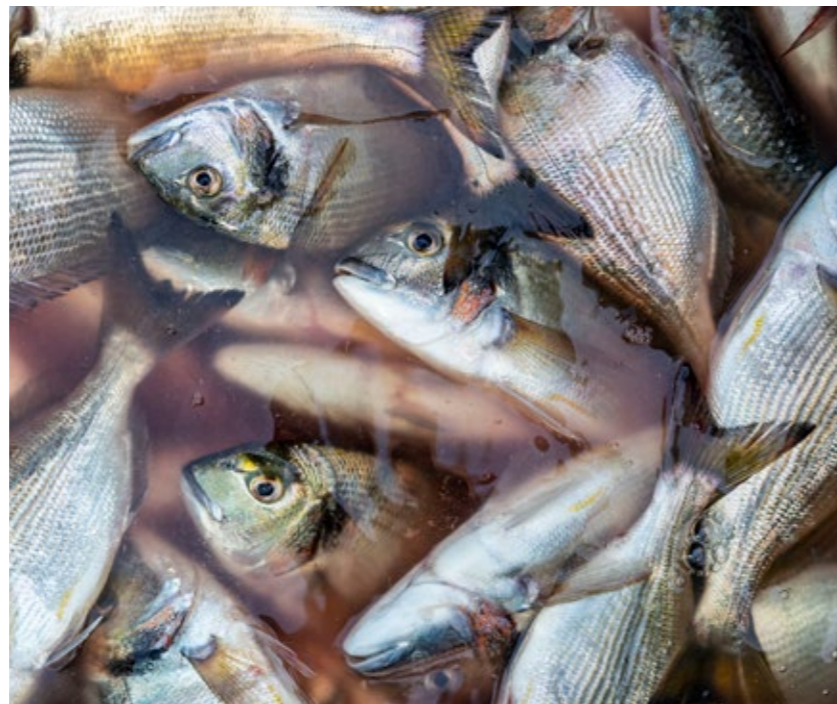
Daurades fraîchement pêchées.