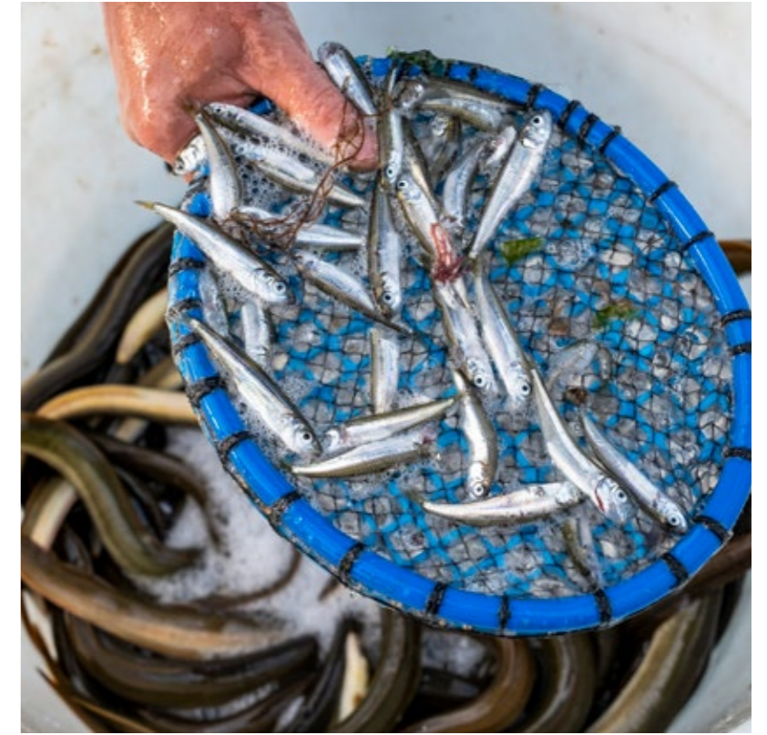
Anguilles et quelques jols pris dans les mailles de la capéchade.

Ce que font les poissons dans l'eau reste encore souvent mystérieux, mais les scientifiques ont découvert que les daurades restaient fidèles à leur lagune.